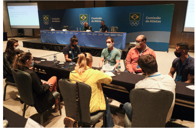
Fotos Fórum CACOB 2021 – Rio de Janeiro – Participantes e Dinâmica de Grupo